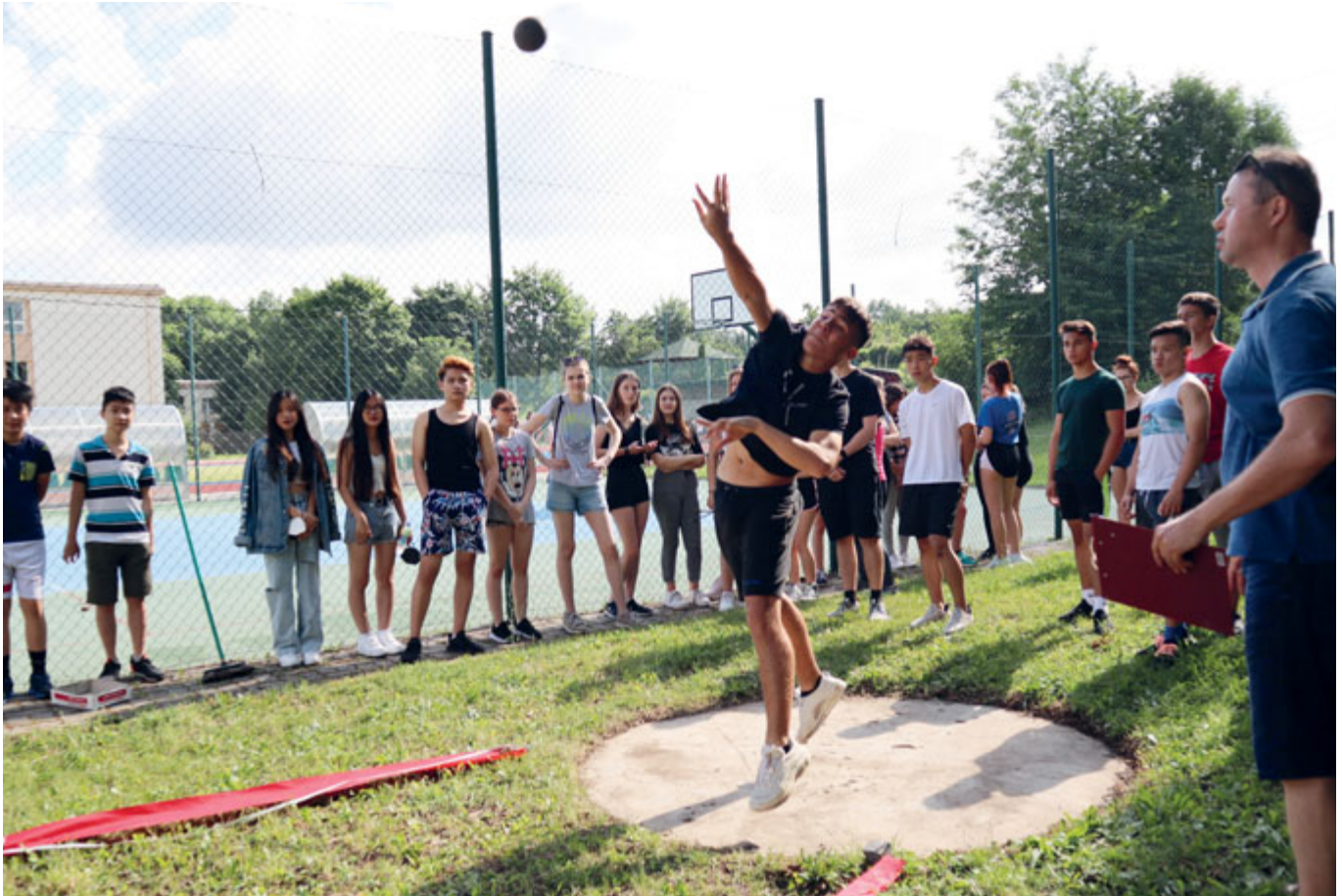
Po mnohaměsíční pauze mohli žáci základních škol opět poměřit své síly v atletických disciplínách. A dařilo se jim.