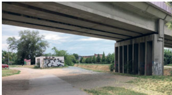
Zanedbaný prostor mezi železničním náspem, ulicí Hladíkovou a řekou Svitavou se může proměnit v odpočinkovou lokalitu s parčíkem a lavičkami

Hlasovat a podpořit nejen tento černovický projekt můžete