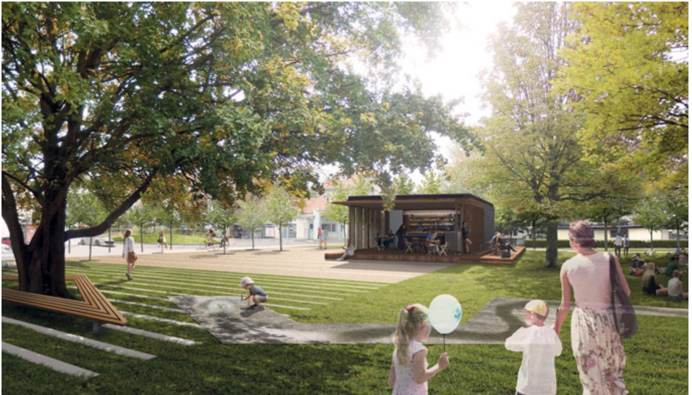
Společenská plocha s kavárnou a hracím potokem

Autorky: Ing. Eva Wagnerová, Ing. arch. Miroslava Zdražilová