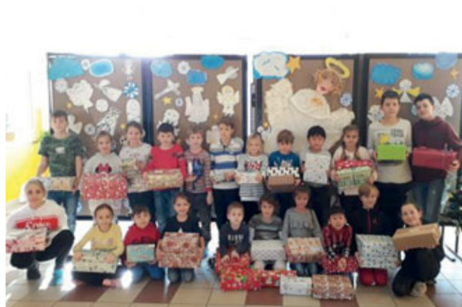
Žáci ZŠ Řehořova

Za Základní školu Kneslova se zapojili dobrovolníci z 8. třídy