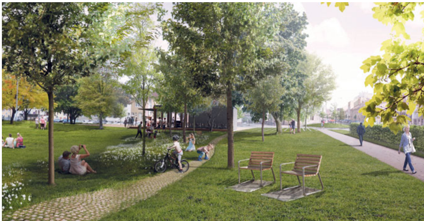
Pěšina mezi habry podél ul. Charbulovy.