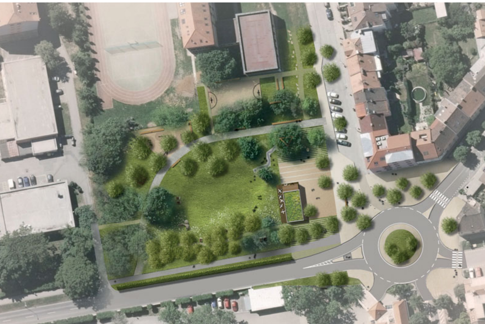
Vítězný návrh na revitalizaci parku Řehořova. Autorky: Ing. Eva Wagnerová, Ing. arch. Miroslava Zdražilová