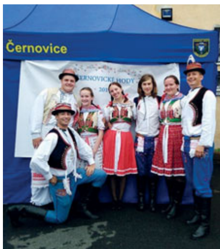
Část Krúžku a Slováčku na Černovických hodech.

Ti všichni do něj přinášeli písně, které znali ze svého okolí.