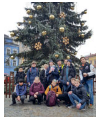
Žáci ZŠ Kneslova v Jihlavě

Sedmáci a osmáci si adventní čas ozvláštnili výlety do blízkých měst Olomouce a Jihlavy. Sedmé třídy měly na programu návštěvu Pevnosti poznání s velmi putavým detektivním programem Kriminálka Olomouc: Vražda Václava III., ve kterém se děti snažily „vyřešit“ pomocí různých zdrojů motiv a pachatele tohoto přes 700 let starého činu. Kromě programu si žáci prohlédli i zbývající čtyři expozice interaktivního muzea. Osmá třída oproti tomu