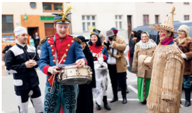
Černovické ostatky 2019

Májek si bere na starosti etnografickou stránku. Chystáme občůzku fašankových masek spolu s Černovickým sdružením