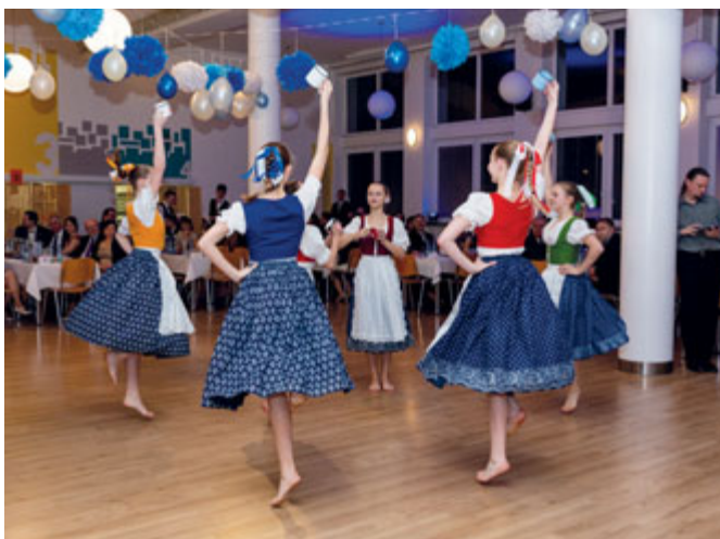
Ukázky lidových tanců v podání Taneční konzervatoře Brno

V pátek 24. ledna se uskutečnil tradiční Černovický ples. Děkujeme všem účastníkům, sponzorům, organizátorům a hostům, mezi kterými letos nechyběla ani ministryně financí Alena Schillerová.