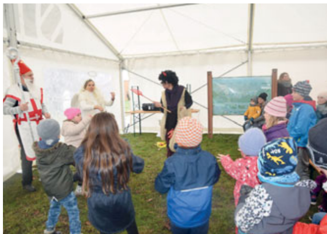
Na Mikulášský jarmark za dětmi dorazil i Mikuláš s andělem a čertem