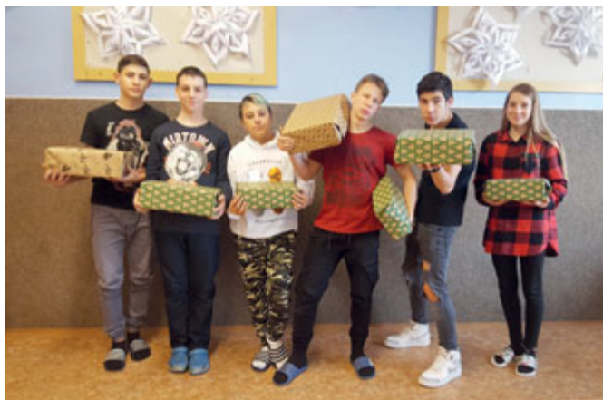
Žáci ZŠ Kneslova

Projekt Krabice od bot učí děti pomáhat vrstevníkům, kteří žijí v sociálně slabších rodinách, azylových domech nebo se krátkodobě ocitli v hmotné nouzi.