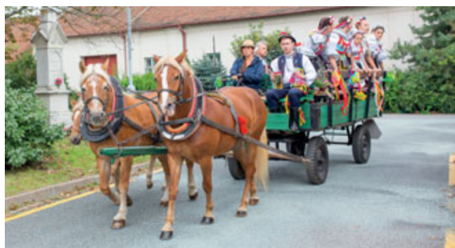
Páteční zvaní na hody

Sobotní počasí nutilo k mnoha změnám, a to jak programových, tak i organizačních, po řadě návrhů bylo nakonec rozhodnuto pro „osekání“ programu a zachování místa konání. Kvůli dešti musel být zrušen tradiční průvod a předání hodového práva proběhlo pod stany na nádvoří bývalého kulturního domu. Návštěvníci tak byli ochuzeni o tradiční sólo hlavního páru s vedním radnice, přesto mohli vidět vystoupení chasy, krojovaných dětí spolu se stárky a černovických folklorních souborů Májkek, Májíček a Slováký krůžek. Nepřízeň počasí nás přinutila zvolit tzv. mokrou variantu, a tak se chasa bohužel odpolední zábavy účastnila dále již bez krojů. Ale ani sobotní návštěvníci nebyli ochuzeni o „půlnoční představení“, které proběhlo před ukončením venkovního programu, tedy již v šest hodin. Večerní program byl společně s cimbálovou muzikou přesunut do Hostince Slunečnice, přičemž stárči se i pro nedostatek prostor rozhodli setrvat venku, kde se spolu s některými návštěvníky bavili tančem a zpěvem.