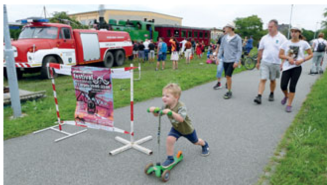
Nábřežní dopravní prostředky: černovické hasičské auto Julča, mašinky a koloběžka