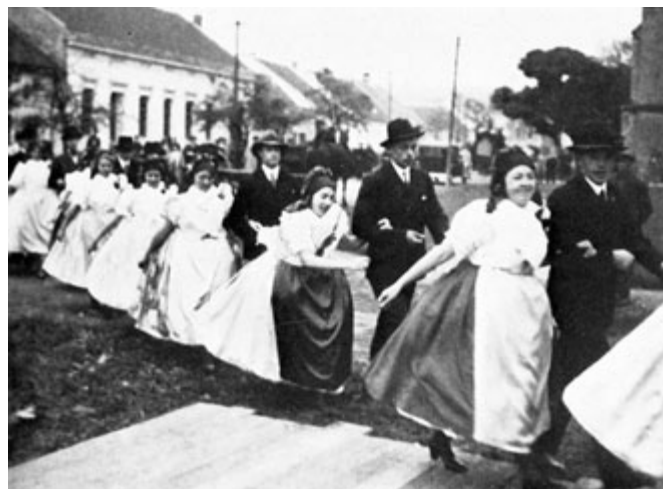
Veselý nástup krojovaných párů se stárky a stárkami a tanečním mistrem k tanci na pódiu před kostelem sv. Floriána při hodech v roce 1934 v Černovicích. (Zdroj: Felkl, Hans – Tomschik, Erich: Heimatbuch der Brünner Sprachinsel. Erbach 1973).

Úryvek z knihy C. Hampela: Vom alten Dorfe und andere heitere Plaudereien, přeložila Jana Nosková