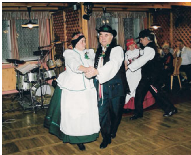
Obnovené černovické kroje