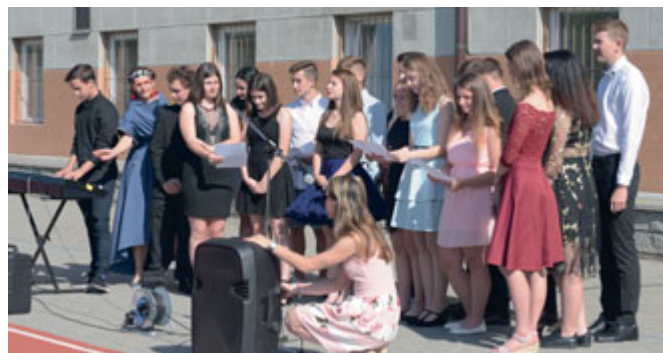
Letošní deváťáci si na rozloučenou se školou pro své publikum připravili upravenou verzi písně Není nutno . A my všichni už konečně víme, že: „Dostat pětku – nevádí. Nemít sváču – vadí. Nemít sešit – nevádí. Zažít stresy – jo, to vadí!“ Přejeme jim, aby těch stresů měli co nejméně a nezapomněli si nosit svačinky!