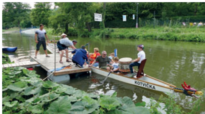
Dráčí loď Kotvička vozila návštěvníky na Slunečním nábřeží v Maloměřicích