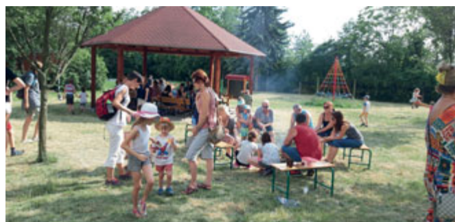
Letní slavnost pro děti ze školní družiny, jejich rodiče i prarodiče na školní zahradě k ukončení školního roku