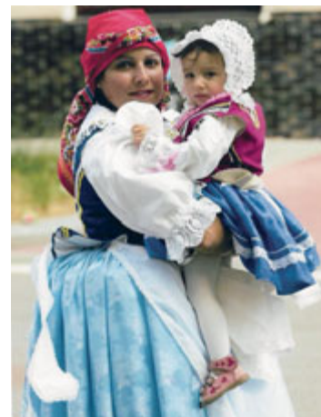
Obnovené černovické kroje

fesionálně jednou rukou, zatímco druhá nenápadně sáhla po sklenici. Přitom na něj flétna závistivě pohlédla. Notně opotřebovaná knížka s notami ležela zcela provizorně na stole – jen kvůli velkému svátku – a všechny špičky bot pravidelně podupávaly do taktu na udusané podlaze. Každý nový kus byl uvítán zavýsknutím dívek, které dosáhlo svého vrcholu krátkým poskokem u májky. Pak se tančilo, točilo, skákalo, objímalo a smálo, zpívalo a pilo – až do setmění.