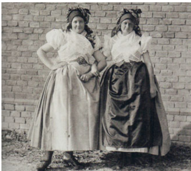
Černovické ženské kroje

fesionálně jednou rukou, zatímco druhá nenápadně sáhla po sklenici. Přitom na něj flétna závistivě pohlédla. Notně opotřebovaná knížka s notami ležela zcela provizorně na stole – jen kvůli velkému svátku – a všechny špičky bot pravidelně podupávaly do taktu na udusané podlaze. Každý nový kus byl uvítán zavýsknutím dívek, které dosáhlo svého vrcholu krátkým poskokem u májky. Pak se tančilo, točilo, skákalo, objímalo a smálo, zpívalo a pilo – až do setmění.