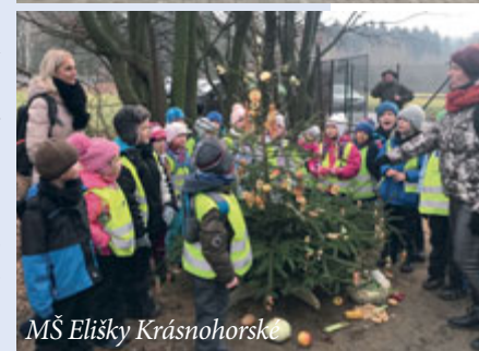
MŠ Elišky Krásnohorské